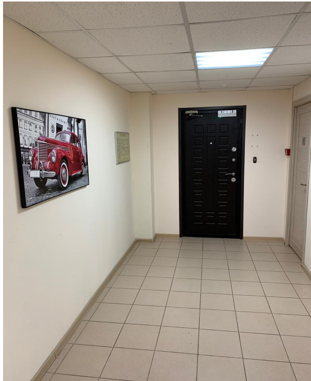
Фото общих зон